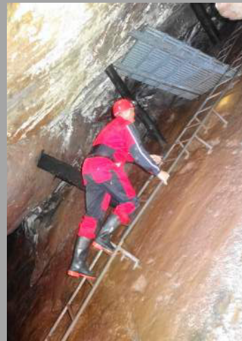
Aufstieg zum Mariastollen

In Kleingruppen gehen wir drei Stunden mit Helmlampen und Gummistiefeln (beides wird gestellt) in die Unteren Stollen. Die Führung geht über drei Stollenebenen. Außer den Leitern ist alles belassen wie im Mittelalter. Lassen Sie sich von geologischen und mineralogischen Besonderheiten begeistern. Auf dem Rückweg wird das Pochwerk vorgeführt.